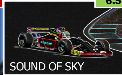
SOUND OF SKY

+ Premiers points de l'année ! La fin de course de Kureha