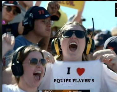
Quelques fans canadiens présents pour soutenir Jones et Crash !!